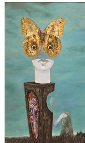
Toison d'or, 1937